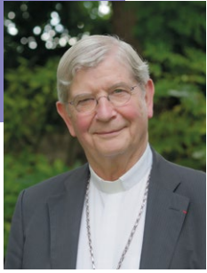
Mgr Laurent Ulrich Archevêque de Paris Président de la Fondation Notre Dame